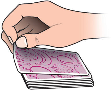
كشف إحدى البطاقات

حتى لا تكون هناك ميزة لك، يتم تدوير البطاقة بعيدًا عنك (الجهة المكشوفة لأعلى). كلما كانت الحركة أسرع، يرى اللاعب أيضًا البطاقة المكشوفة بشكل أسرع.