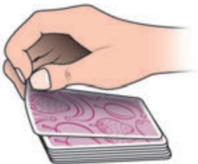
Kaardi ümber pööramine.

Mängija peab pöörama kaardi ümber suunaga endast väljapoole, nii, et ta ei näeks kaarti enne kui teised mängijad. Mida rutem mängija kaardi ümber pöörab, seda kiiremini näeb ta seda ka ise.