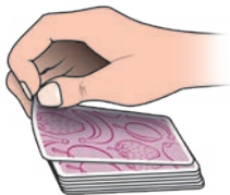
Bir kartın açılma şekli.

Oyuncu kendine bir avantaj sağlamamak için kartı karşı tarafa doğru açar, kendine doğru değil. Hareket ne kadar çabuk olursa kendisi de açılan kartı o kadar hızlı görebilir.