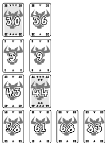
Afb. 4: toont de 4 rijen na de 3e ronde.

3, 9, 68 en 83. De „3“ is de laagste kaart en moet als eerste worden aangelegd. Deze past in geen enkele rij, dus moet de speler een willekeurige rij nemen. Hij kiest de 2e rij en neemt de „37“. Met zijn „3“ start hij een nieuwe 2e rij. De speler met de kaart „9“ heeft geluk, hij kan zijn „9“ nu na de „3“ leggen.