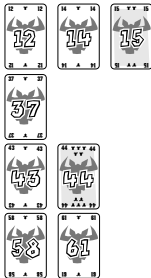
Afb. 2: toont de 4 rijen na de 1e ronde.

Zoals afbeelding 1 toont, hebben de laatste kaarten van de 4 rijen de volgende waarden: 12, 37, 43 en 58. Vier spelers spelen de volgende kaarten uit: 14, 15, 44 en 61. De „14“ is de laagste kaart. Deze wordt als eerste aan een rij toegewezen. Conform regel 1 kan deze alleen in de eerste rij achter de „12“ worden gelegd; hetzelfde geldt voor de kaart „15“. De kaart „44“ kan volgens regel 1 zowel in de 1e, 2e of 3e rij worden gelegd. Maar, volgens regel 2 „kleinste verschil“ komt de kaart in de derde rij. De kaart „61“ moet volgens regel 2 in de vierde rij worden gelegd.